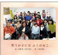
笑うかどにはふくのねこ

2021年は、開所6周年記念イベ ントが開催でき、途中コロナ感染者急 増でお休みもしましたが、皆様にご 協力頂き、おおむね運営できた1年 でした。