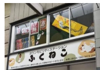
ステーションの2階にも 作品を展示中！