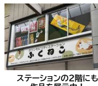
ステーションの2階にも 作品を展示中！