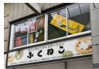
ステーションの2階にも 作品を展示中！