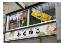
ステーションの2階にも 作品を展示中！