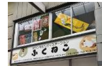
ステーションの2階にも 作品を展示中!