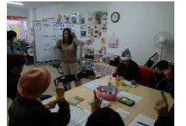
開催の様子 左)童謡教室 右)手話カフェ