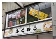
ステーションの2階にも 作品を展示中！